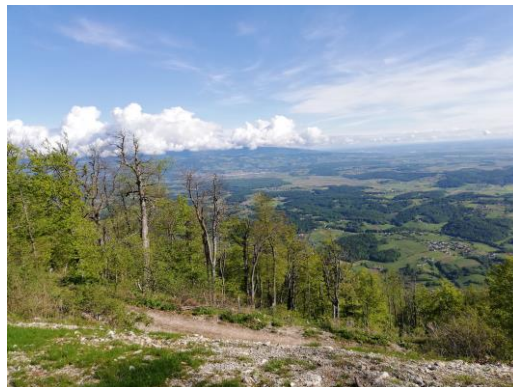
Pogled z vrha Boča proti Pohorju

Oprema: Vremenu primerno: dobra, nepremočljiva obutev in ustrezna obleka (zaščita proti vetru, dežju ...)