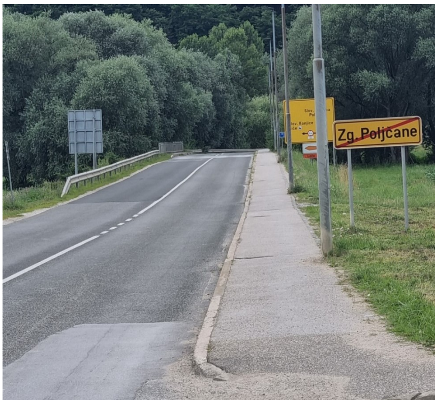
Slika 13: Cesta Zg. Poljčane-Poljčane (Visoke hitrosti avtomobilov in tovarnjakov)