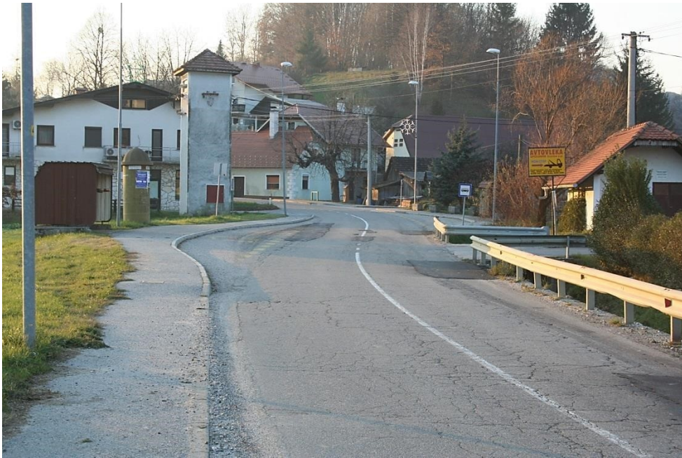
Slika 9: Avtobusno postajališče Lušečka vas

(Na desni strani cestišča manjka nekaj deset metrov pločnika, je sicer označen prehod za pešce, vendar pa dostop do njega predstavlja nevarnost za otroke in tudi druge pešce. Če hočejo priti do obstoječega pločnika in prehoda za pešce, morajo hoditi po vozišču ob zaščitni ograji.)