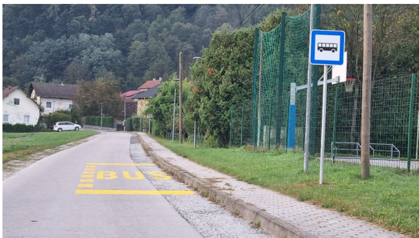
Slika 3: Začasno zarisano avtobusno postajališče Studence