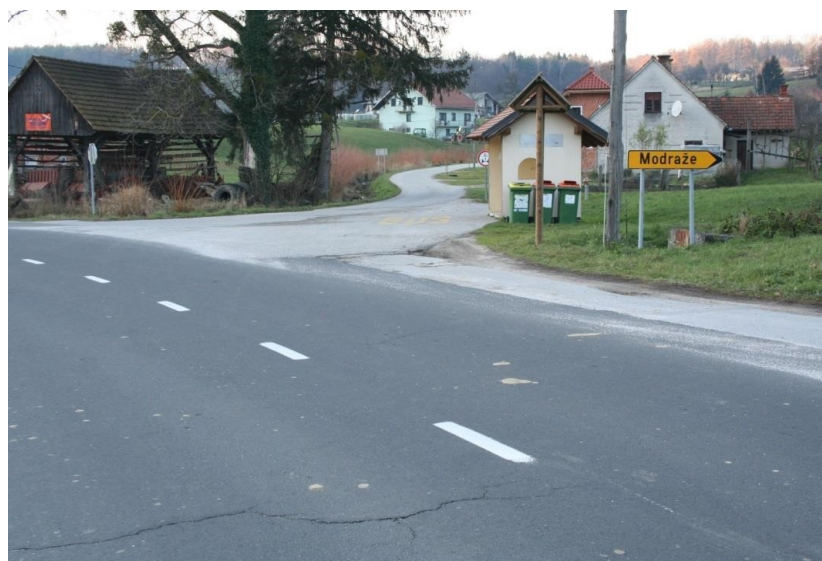
Slika 5: Avtobusno postajališče Modraže v smeri Poljčan