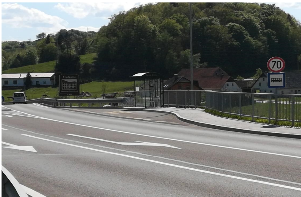
Slika 11: Avtobusno postajališče Spodnja Brežnica za smer Slov. Bistrica