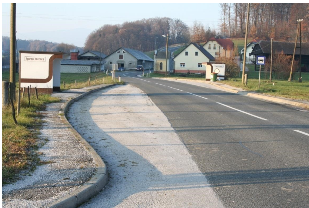
Slika 12: Avtobusno postajališče Zgornja Brežnica (Ni označenega prehoda za pešce.)