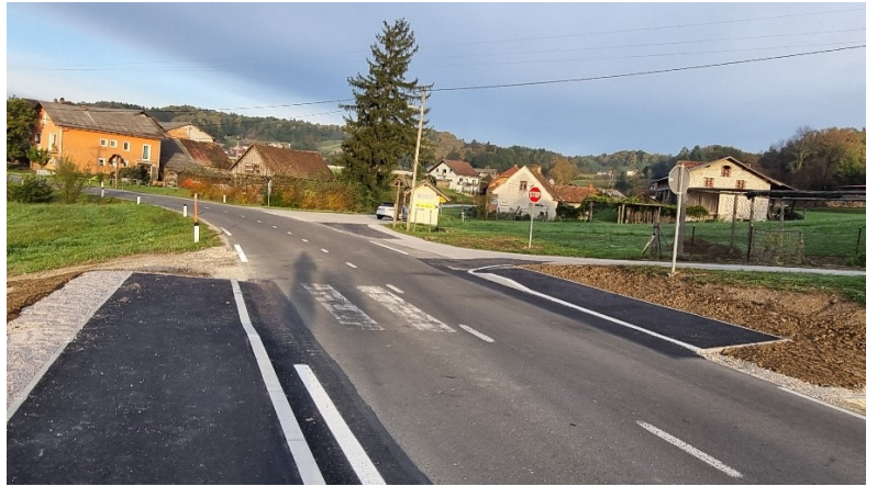
Slika 6 in slika 7: Avtobusno postajališče Modraže v smeri Globoko (nova postaja s prehodom za pešce)