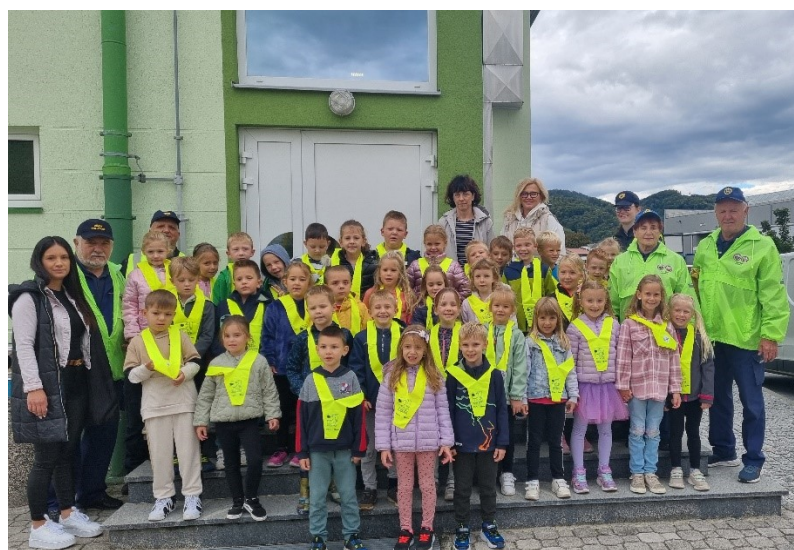
Slika 14: Prvošolci 2024/25 s člani ZŠAM