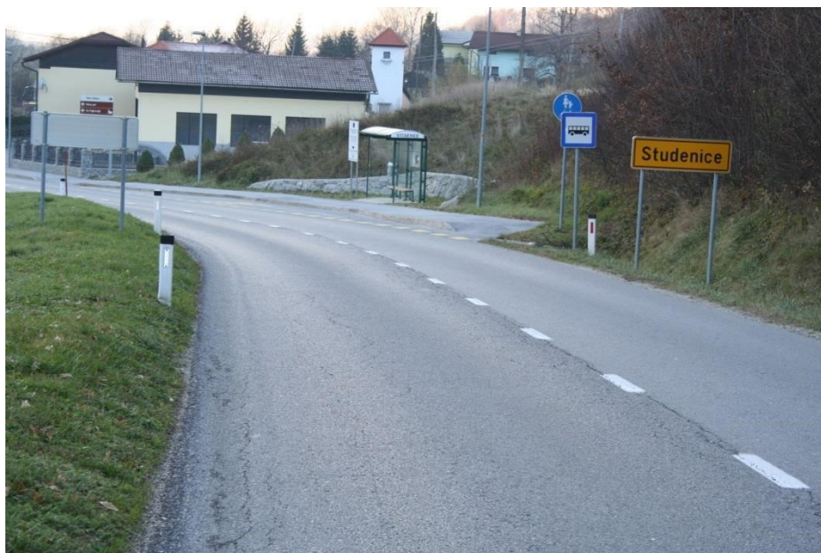
Slika 2: Avtobusno postajališče Studenice (Ni označenega prehoda za pešce.)