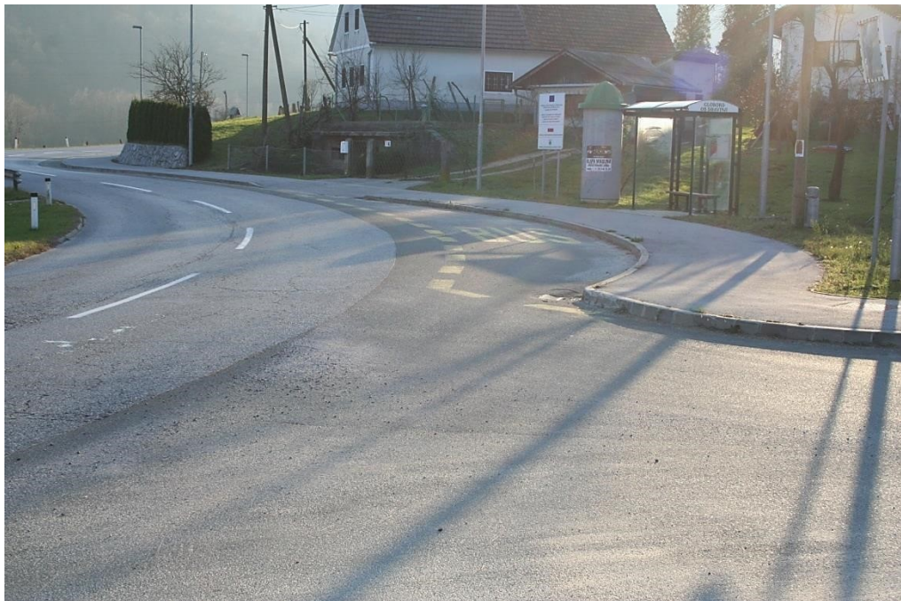
Slika 8: Avtobusno postajališče Globoko (Na levi strani ceste ni avtobusnega postajališča, ni označenega prehoda za pešce.)