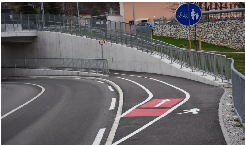
Slika 1: Izven nivojsko prečkanje železniške proge pri žel. postaji v podhodu

Učenci prihajajo v šolo po lokalnih cestah ob levem delu cestišča. Ceste so dokaj ozke, zato morajo biti pozorni na vse udeležence v prometu. Posebej previdni morajo biti pri prečkanju železniške proge. Le-to prečkajo v podhodu pri železniški postaji po stopnicah/dvigalu. Hoja po ozkem pločniku ob cesti podvoza NI DOVOLJENA. Bistriško cesto kasneje prečkajo na prehodih pri Glasbeni šoli ali občini.