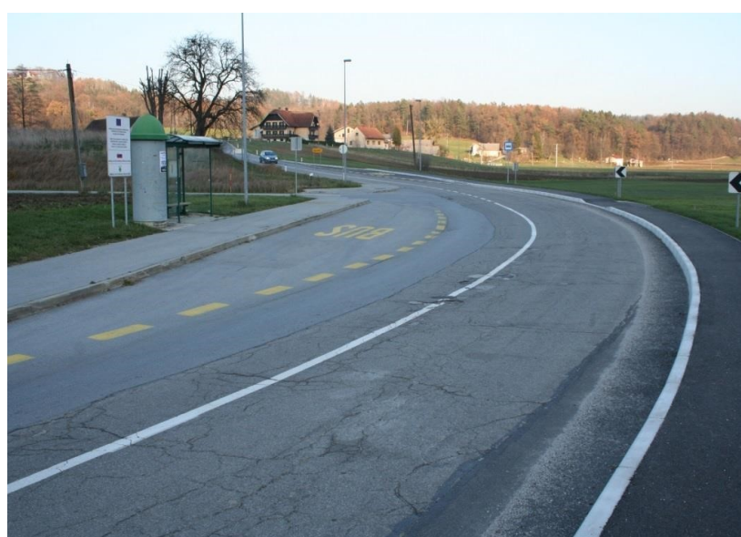
Slika 4: Avtobusno postajališče Novake (Ni označenega prehoda za pešce.)