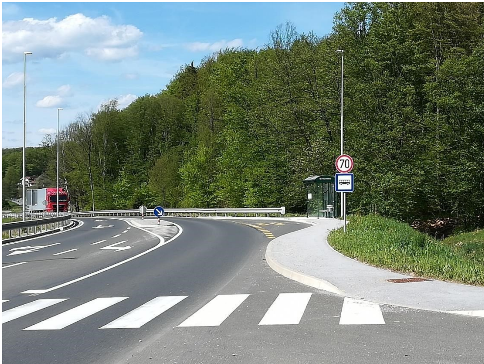
Slika 10: Avtobusno postajališče Spodnja Brežnica za smer Slov. Bistrica

(Na desni strani cestišča manjka nekaj deset metrov pločnika, je sicer označen prehod za pešce, vendar pa dostop do njega predstavlja nevarnost za otroke in tudi druge pešce. Če hočejo priti do obstoječega pločnika in prehoda za pešce, morajo hoditi po vozišču ob zaščitni ograji.)