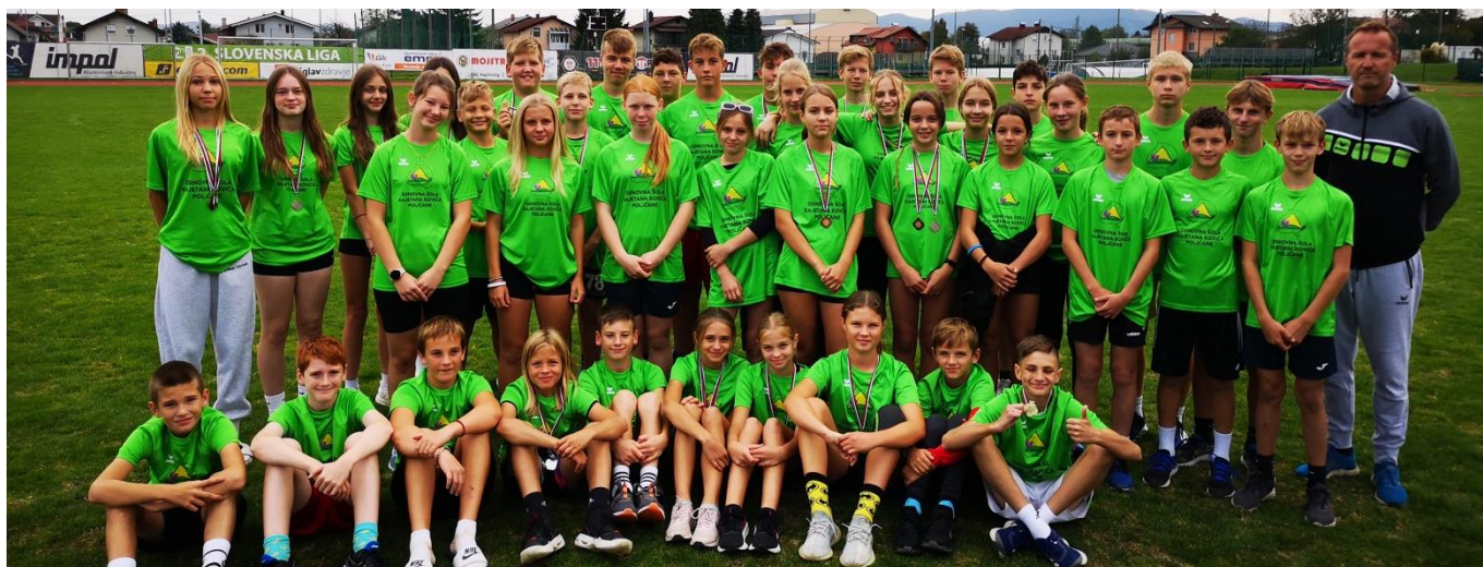
Tekmovalci OŠ Kajetana Koviča Poljčane na atletski olimpijadi