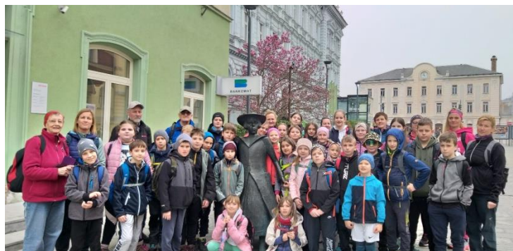
Celje in Brnica

Vsem prejemnikom priznanj čestitamo. Hvala mentoricam. Hvala strokovnim sodelavcem PD Poljčane za njihovo prostovoljno delo. Hvala tudi Osnovni šoli Kajetana Koviča Poljčane in ŠŠD Bogdana Krajnca, ki z naklonjenostjo spremljata planinski naraščaj. Hvala Občini Poljčane, ki ceni naš trud in nas podpira.