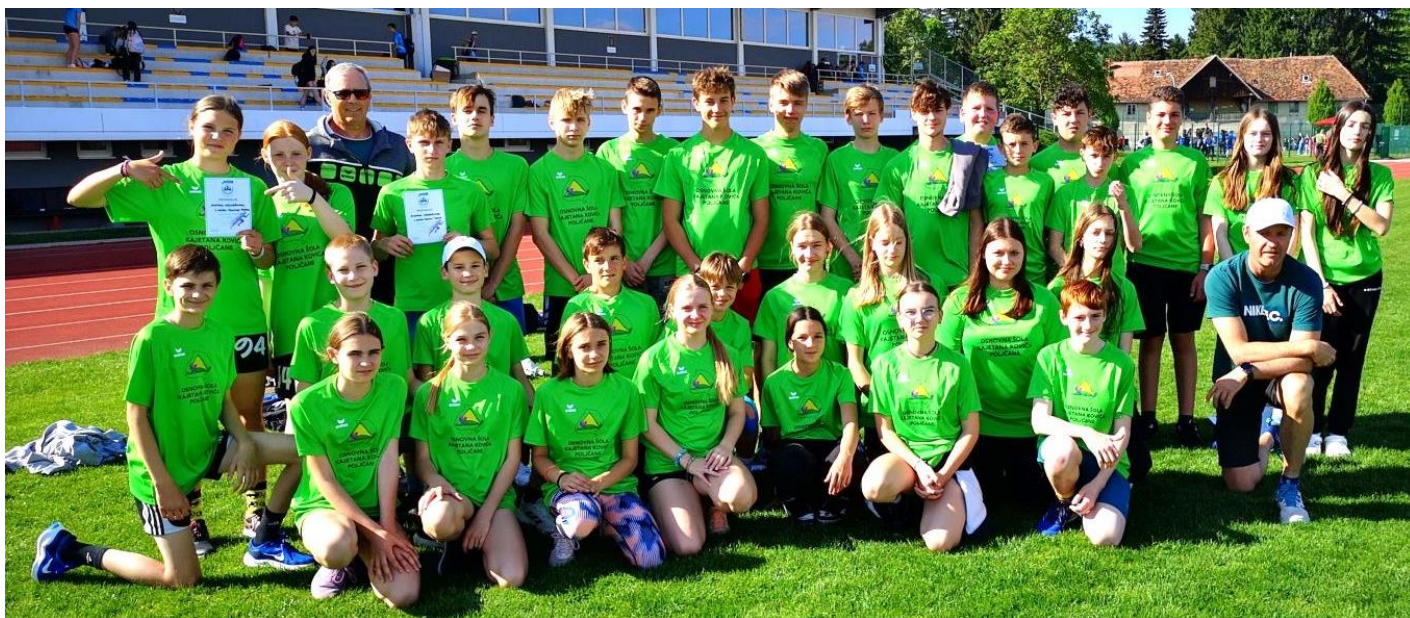
Šolska ekipa OŠ Kajetana Koviča Poljčane na atletskem posamičnem tekmovanju