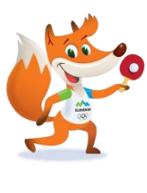
Foksi – namizni tenis