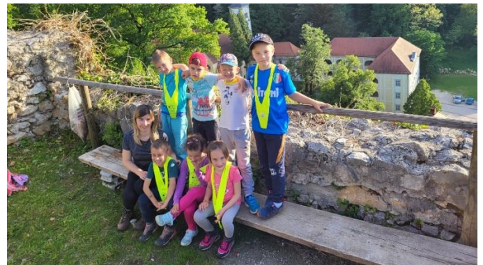
Izlet na Boč in v Studenice