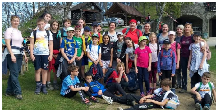
Izlet na Mrzlico