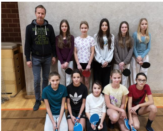
Deklice, ki so sodelovale na šolskem tekmovanju.