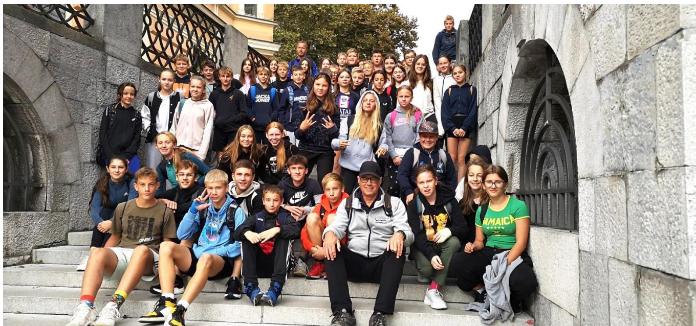
Udeleženci olimpijskega festivala v Ljubljani