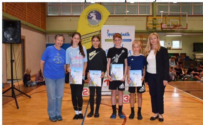
Zlata planinska priznanja