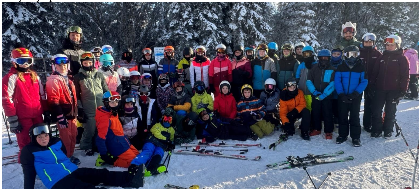
Učenci 6. a in b razreda v zimski šoli v naravi

smo namenili različnim dejavnostim. Določili so imena svojih sob in narisali plakate, ki so predstavljali njihove sobe. Preizkusili so se v športnem kvizu, izvedli smo igro na srečo bingo, pripravljali so predstavitev sob. Nagrajenci vseh iger in tekmovanj so prejeli nagrade, kot so: šilček, beležka, zvezek, svinčnik, barvni markerji itd. Zadnji večer smo se odpravili na zabavo v disko, kjer jih je presenetila Nuša Derenda, ki je zapela nekaj svojih pesmi.