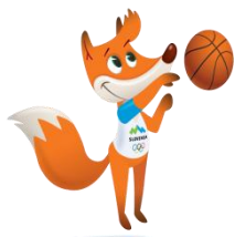
Foksi – košarka