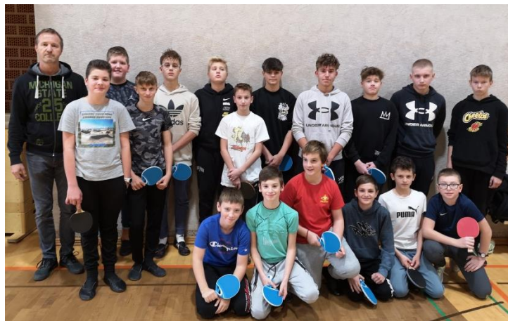
Dečki, ki so sodelovali na šolskem tekmovanju.