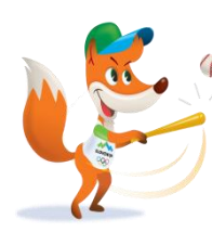
Foksi – teeball