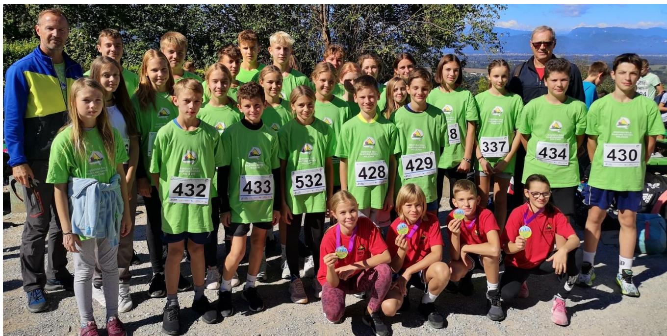
Ekipa naše šole na 23. gorskem teku