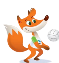
Foksi – odbojka