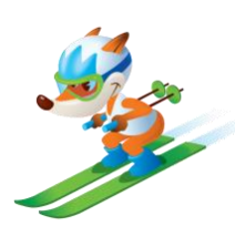
Foksi – smučanje