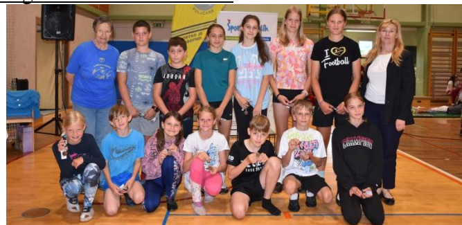
Bronasta planinska priznanja