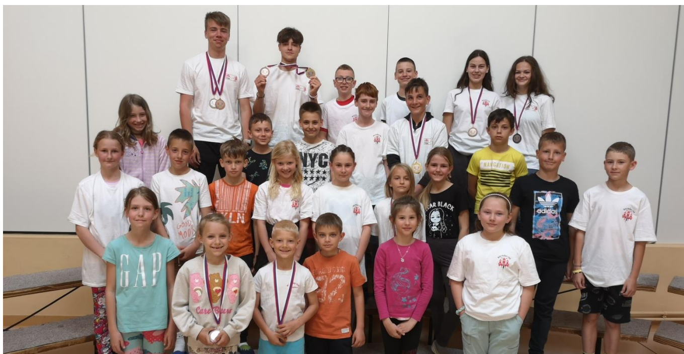
Tekmovalci na bistrškem teku, manjkajo učenci 8. razreda, ker so bili v šoli v naravi.