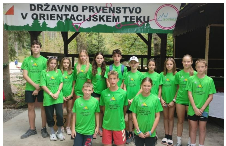
Tekmovalci naše šole.