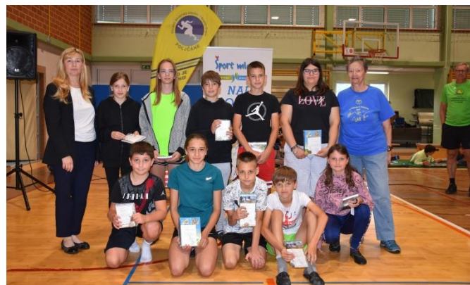
Srebrna planinska priznanja