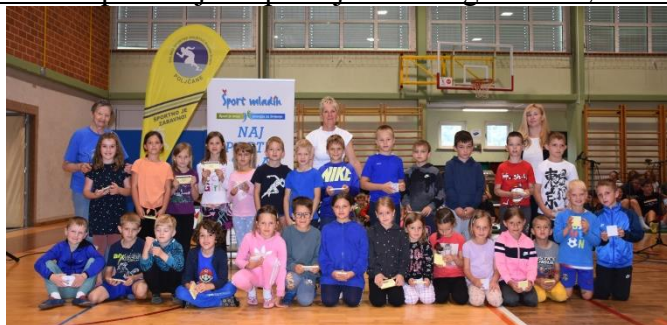
Planinska priznanja 1., 2. razred