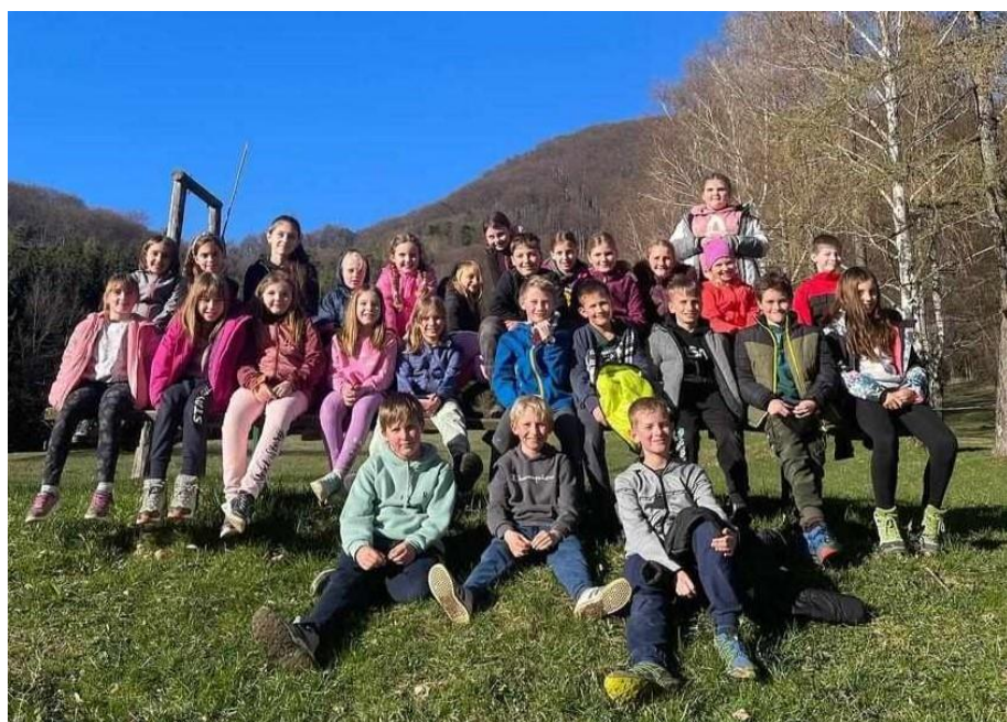
Planinska šola na Boču