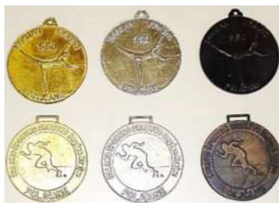
Lastne medalje društva (spodnje je naredil in poklonil Srečko Pirš).