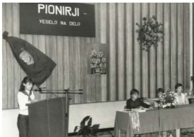
Občni zbor leta 1982.