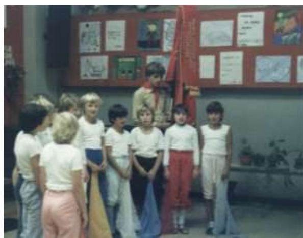
Nastop na občnem zboru leta 1985.