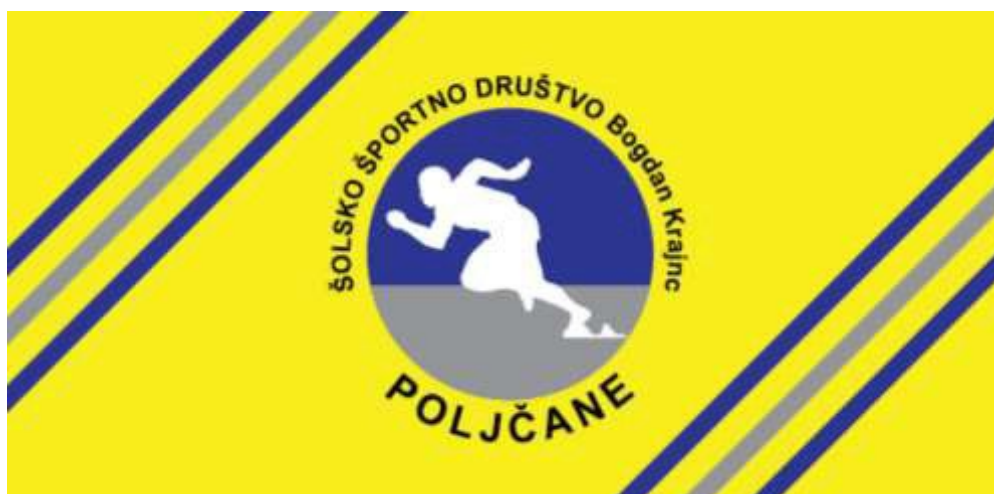
Zastava društva narejena leta 2020.