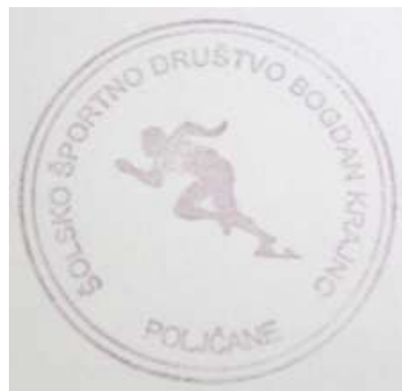
Žig društva iz leta 2000.