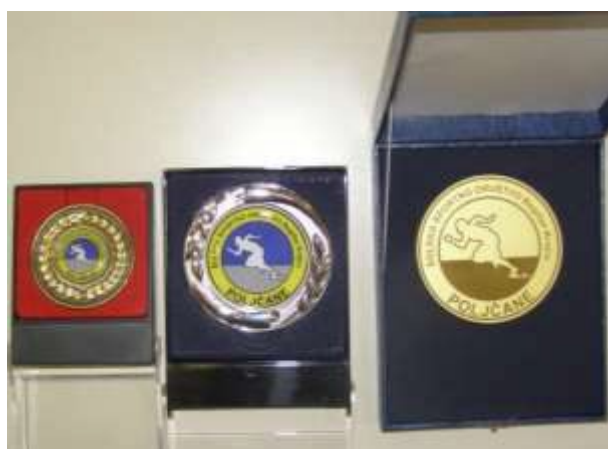
Lastne plakete društva.