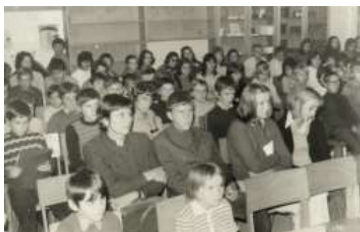
Občni zbor leta 1974.