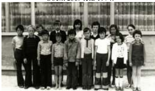
Razredni delegati leta 1974.