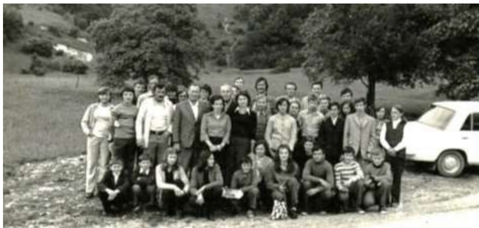
Srečanje šolskih športnih društev občine Slovenska Bistrica in ustanovitev občinskega centra šolskih športnih društev leta 1971 na Boču.