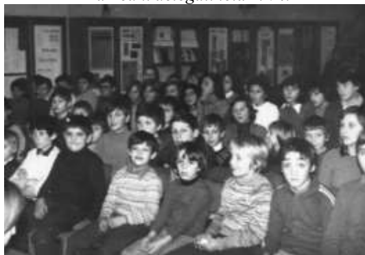
Občni zbor leta 1976.