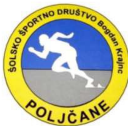
Znak društva iz leta 2000.