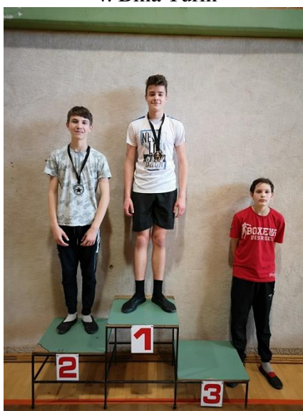
Dečki, 8., 9. razred