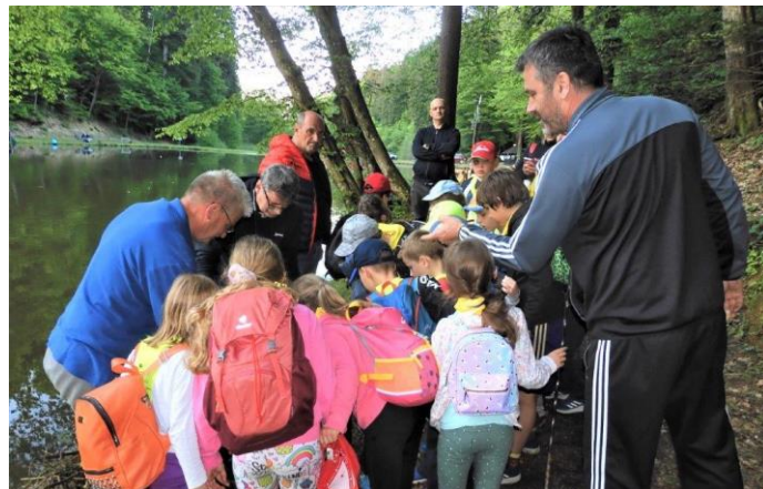
Srečanje z ribiči v Štatenbergu

Pa se ustavimo pri tistih, ki so si letos »prihodili« priznanja in medalje.