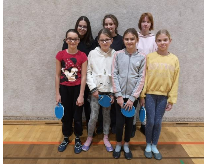
Tekmovalke naše šole.