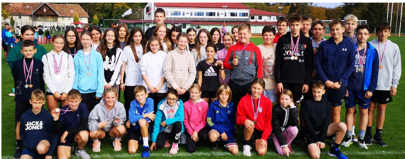
Ekipa OŠ Kajetana Koviča Poljčane