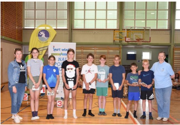
Srebrna planinska priznanja