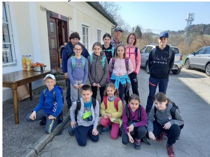
Rojstna hiša Antona Martina Slomška

Začelo se je s 7-dnevnim taborom na Dovjem, kjer so mladi planinci opravili kar 4 izlete in pohode, obiskali planinski muzej v Mojstrani, se kopali ter imeli veliko predavanj in praktičnih vaj iz planinske šole. Med letom pa smo za skupino pripravili že 18. tradicionalni nočni pohod do planinskega doma na Boču. Šli smo okoli Ptujškega jezera, za Božič pa odšli obiskat Božička do planinskega doma na Boču. »Neznano« se je izkazalo kot Janče, točka Zasavske poti v bližini Ljubljane. V času cvetenja velikonočnice smo obiskali Boletino pri Ponikvi in rojstno hišo Antona Martina Slomška. Dvodnevne dogodivščine na Boču pa so udeležencem dale veliko znanja iz planinskih veščin, pripravili so veliko delavnic, iger na prostem in tudi pohod ni izostal. Obiskali smo še planinski dom na Resevni in šli ob Dravinji od dvorca Štatenberg do Poljčan. Poleg vseh naštetih so mladi planinci imeli na voljo še zimski pohod k stolpu na Boču, TRIM-pohod ob dnevu upora in pohod družin k stolpu ob prazniku Občine Poljčane. Nekateri mladi pohodniki so se nekajkrat pridružili tudi skupini odraslih, kar je bila posebna izkušnja.