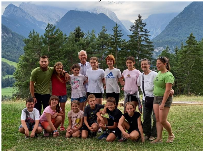
Tabor na Dovjem