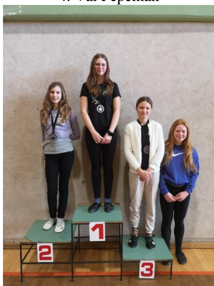
Deklice, 6., 7. razred