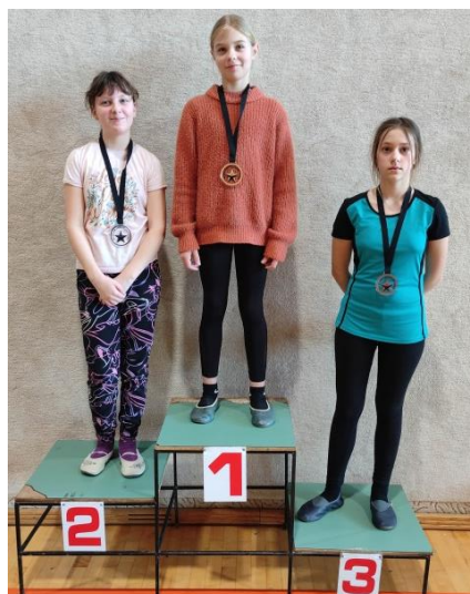
Deklice, 4., 5. razred