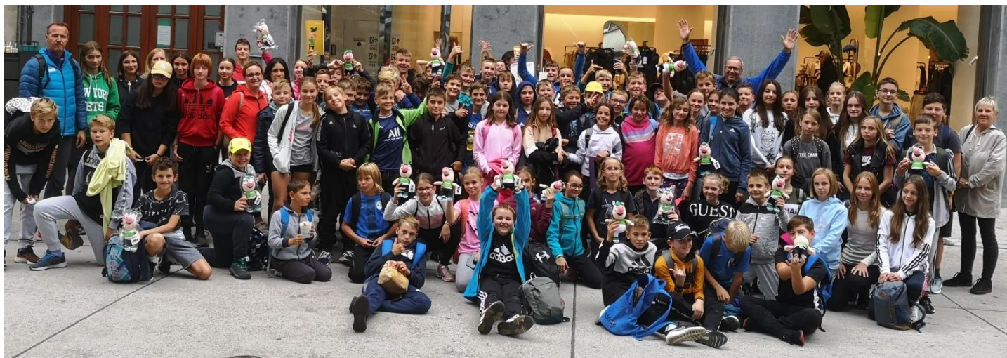
Udeleženci olimpijskega festivala v Ljubljani

festivala je mladim predstaviti šport v vsej veličastnosti, a vendarle na igriv, zabaven in zanje primeren način, da začutijo in vzljubijo šport, in s tem postane sestavni del njihovega življenja. Otroci se lahko preizkusijo in spoznajo številne športne panoge ter opravijo različne športne izzive, kjer bodo prebudili športnega duha, starši pa notranjega otroka. Obenem je to čudovita priložnost, da preživimo dan brez socialnih omrežij, računalniških igrvic, tablic, pametnih telefonov in aplikacij, katerih posledice so vidne pri socializaciji mladih, pomanjkanju pravih, iskrenih odnosov in seveda pri gibanju. Olimpijski festival je sicer le drobec v želji po spremembah, v želji po aktivaciji najmlajših, vendar smo prepričani, da je na daljši rok mogoče premikati gore. Športniki so najboljši ambasadorji svojih športnih panog, vzor premišljenosti, odločnosti, pokončnosti, iznajdljivosti, spretnosti, vztrajnosti, poštenega dvoboja in ne le telesne, temveč tudi miselne moči. Prav vsi obiskovalci jih bodo imeli možnost spoznati ter se z njimi pomeriti v športnih izzivih. In ker so najboljši vrhunski športniki za svoj trud poplačani z nagradami, bodo mladi za vztrajnost nagrajeni tudi na Olimpijskem festivalu. Vsak obiskovalec, ki opravi določeno število športnih izzivov, bo nagrajen z diplomo in knjigo Foksi in športni duh. Vsekakor dobra motivacija za vse mlade športne upe!«