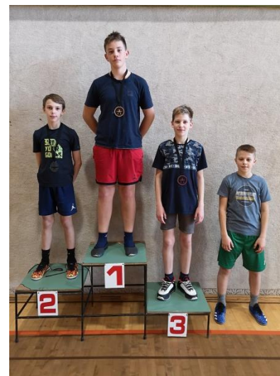
Dečki, 6., 7. razred