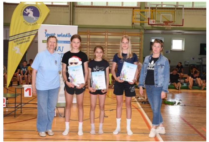
Zlata planinska priznanja