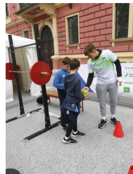
Seznanjanje z različnimi športi