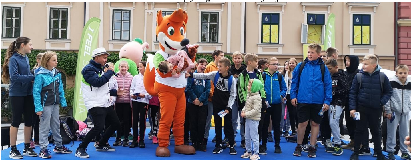
Otvoritev olimpijskega tekmovanja