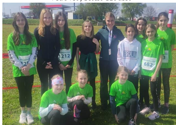
Naše učenke z atletinjo Marušo Mišmaš Zrimšek