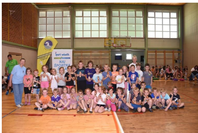
Planinska priznanja 1., 2. razred