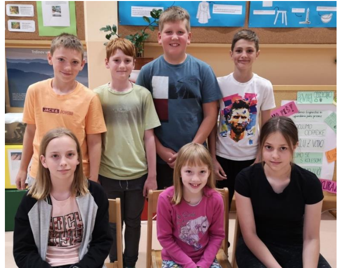
Ekipe D12 in F12 na državnem finalu.