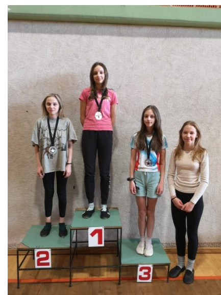
Deklice, 8., 9. razred