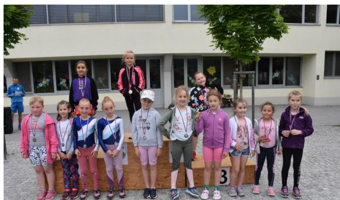
Deklice, 1., 2. razred, letnik 2015, 2016