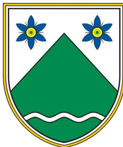
OBČINA POLJČANE Bistriška cesta 65 2319 Poljčane