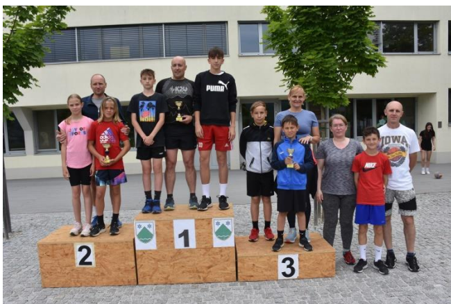
Družinski tek, ostali