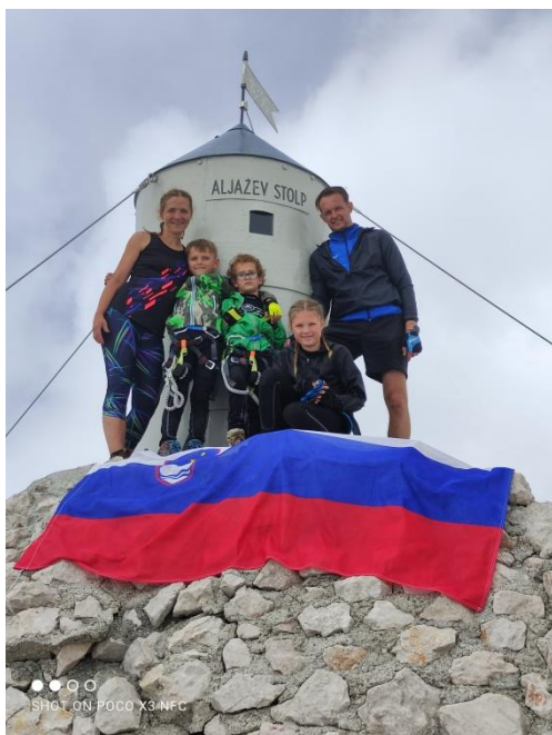
Na vrhu Triglava