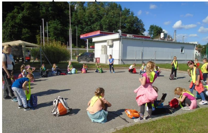
1., 2. razred – brez igre ne gre

Pa preidimo na šolsko leto 2022/23. V letu 2022 je bilo v PD Poljčane včlanjenih 118 učencev OŠ Kajetana Koviča v Poljčanah, v letu 2023 pa 103. Število bi želeli zopet povečati in uspešno nadaljevati tradicijo planinstva v Poljčanah. Začeli so naši predniki pred 94 leti, nadaljevali vaši stari starši, starši in prijatelji. Ostanimo ali postanimo planinci tudi mi.