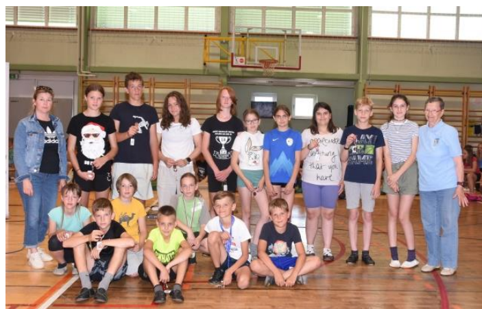
Bronasta planinska priznanja