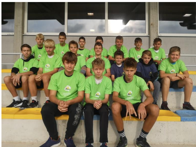
2. mesto, ekipa dečkov

Atletika je kraljica športov tudi na naši šoli. V atletskih disciplinah, krosu in gorskem teku dosegamo odlične posamezne in ekipne rezultate tudi v državnem merilu. Jeseni smo tekmovali na področnem ekipnem atletskem tekmovanju. Pri dečkih in deklicah smo osvojili drugo mesto.