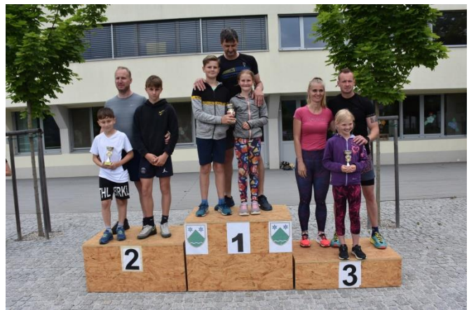
Družinski tek šola II