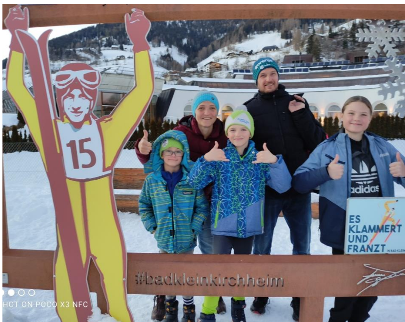
Skupaj na smučanju