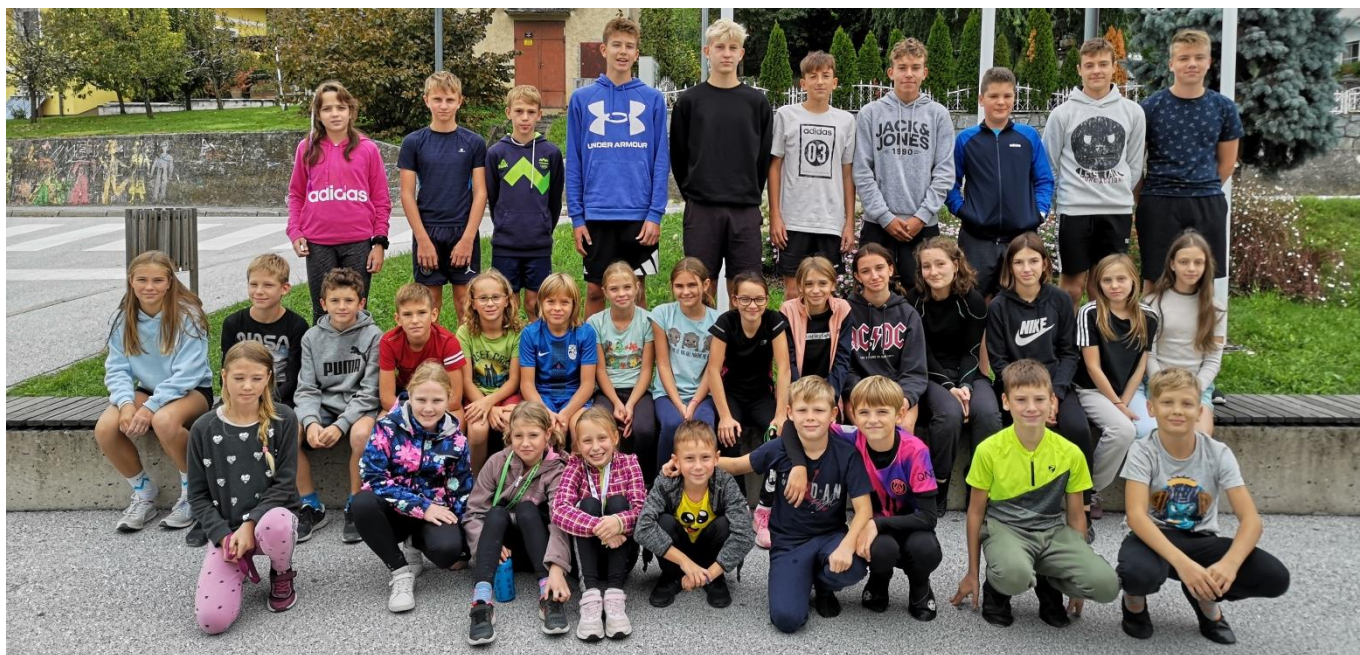
Celotna ekipa naše šole na medobčinskem krosu

Na naši šoli smo v okviru prvega športnega dne izvedli šolski kros, nato pa smo bili gostitelji medobčinskega tekmovanja v krosu. Tekmovali so učenci iz osnovnih šol občin Makole, Oplotnica, Slovenska Bistrica in Poljčane. Skupaj je tekmovalo 225 otrok. Z rezultati naših učencev smo bili zelo zadovoljni. V celoti so zadovoljili naša pričakovanja. Bili so odlični v posamezni in ekipni konkurenci. Vseekipno smo osvojili prvo mesto in osvojili velik pokal.