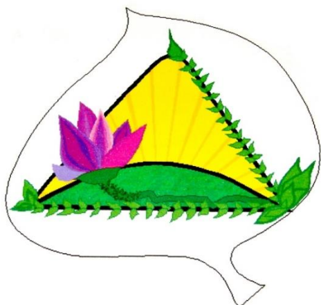
OSNOVNA ŠOLA KAJETANA KOVIČA POLJČANE Dravinjska cesta 26 2319 Poljčane