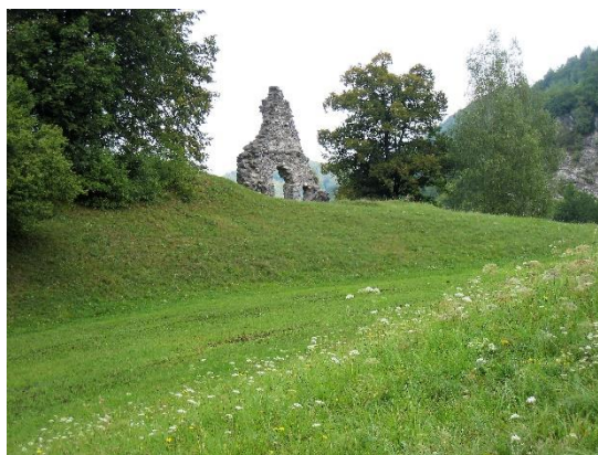
Ostanki cerkve v Jagrščah

Izlet vodi in prijave zbira do četrтка, 1. junija 2023 Andreja Erdlen (041 650 952).