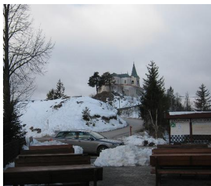
Cerkev na Zasavski Sveti gori