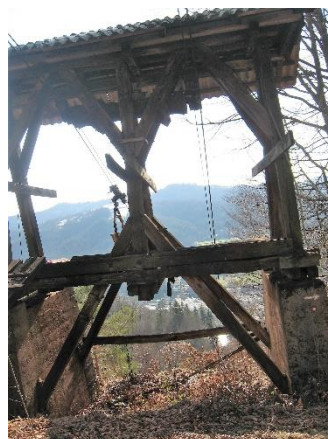
Na poti sestopa v Kresnice

Odhod vlaka iz Poljčan ob 5.53 , povratek predvidoma z vlakom ob 17.59 (naslednji приход vlak ob 19.32).